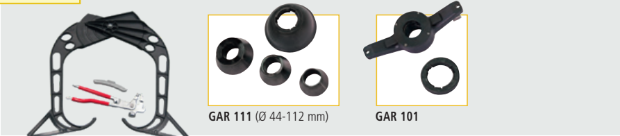
GAR 111 (Ø 44-112 mm)