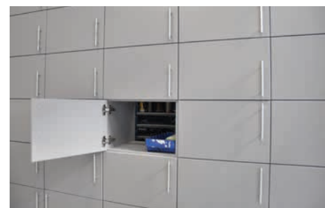
Het automatiekmodel wordt bij Wassink gebruikt voor onderdelen. Vanuit de magazijnkant worden de kasten gevuld zodat monteurs deze niet bij de magazijnbalie hoeven te komen ophalen.

nu gaat om de centraal gelegen receptiebalies, de showrooms of de comfortabele wachtruimte op de etage: overal is de merk-scheiding aangebracht. Juist op die etage is het effect goed zichtbaar: stoelen aan tafel in het Ford-gedeelte, gevolgd door fauteuils bij Kia en weer iets andere bij Peugeot. Over de balustrade de showroom inijkend vallen meteen de industriële hanglampen bij Peugeot op, terwijl Kia kiest voor een andere vorm van hangende verlichting. Het effect is dat Kia met de lichte vloer, het vele licht en het rood van de merkuitstraling direct een andere sfeer opwekt dan bij de naastgelegen Ford-kant. Daar is de verlichting juist weggevoerd in het plafond. Omdat er geen muren zijn die tot het plafond doorlopen, kijk je vanaf de etage over de drie merken uit. En wat blijkt? Overal is reuring in het bedrijf, of het gaat om gasten in de wachtruimte, in de transparante verkoopkantoren en aan de receptiebalies. “We verwachten dit jaar op deze locatie zo’n 2100 nieuwe auto’s te verkopen. Dat zou een marktaandeel in Nijmegen betekenen van ruim twintig procent. Voor de