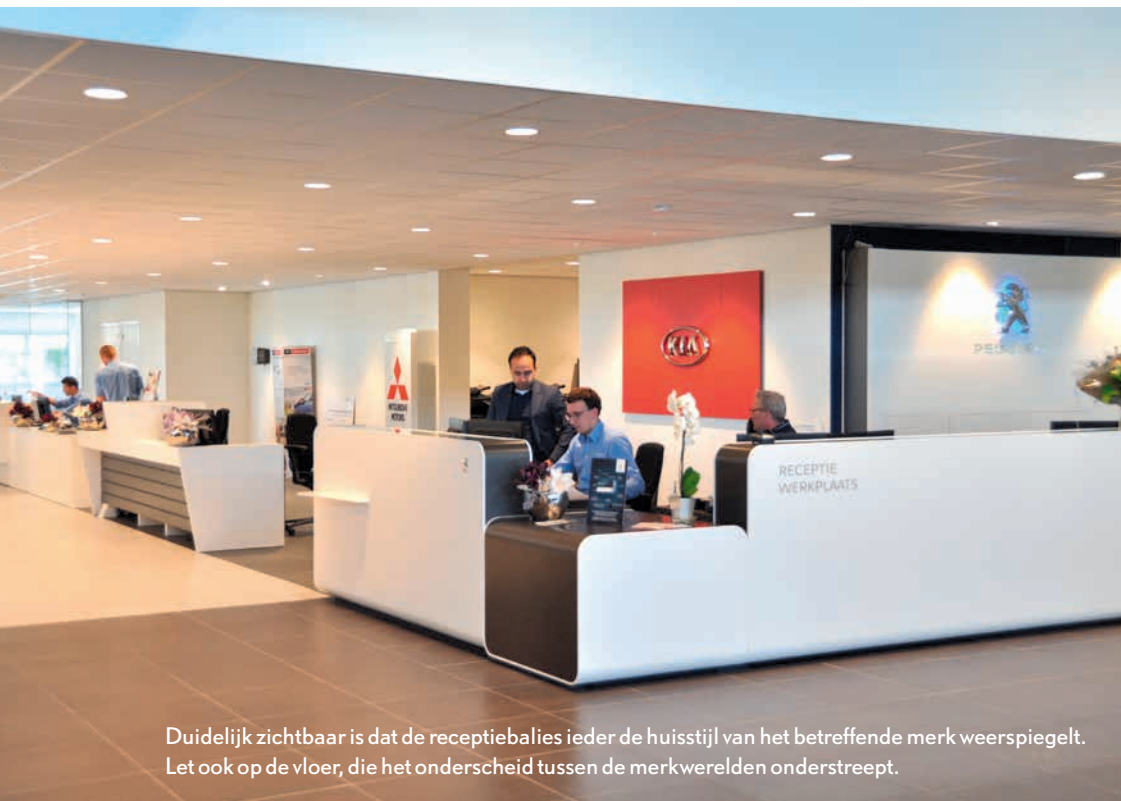
Duidelijk zichtbaar is dat de receptiebalies ieder de huisstijl van het betreffende merk weerspiegelt. Let ook op de vloer, die het onderscheid tussen de merkwelden onderstreept.